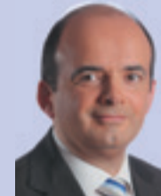
Брюно Анселэн Генеральный директор Renault в России