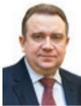
Alexey Rakhmanov Deputy Minister Industry and Trade of Russian Federation