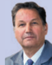
Бу Андерссон Президент АВТОВАЗ