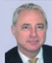
Энди Ротери Главный Исполнительный Директор JATO Dynamics